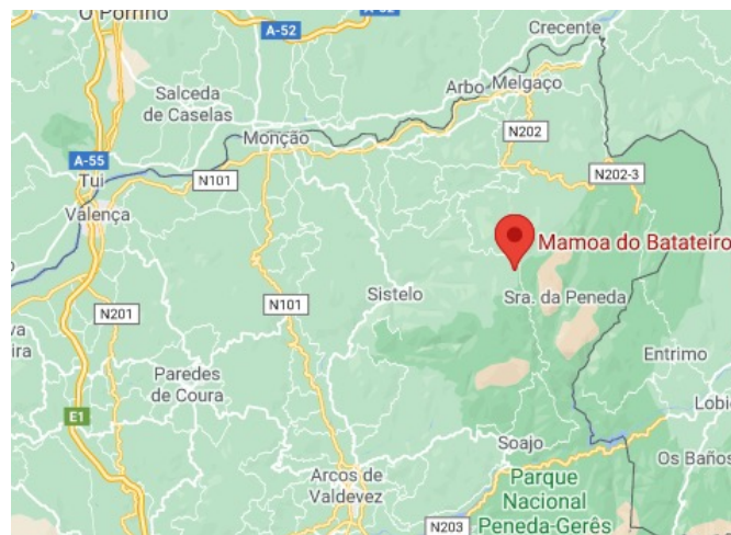
Fig. 1a - Mapa de localização (google maps)

O Dólmen do Batateiro é um monumento megalítico, datado do período Neo-Calcolítico, de razoáveis dimensões, constituído por sete esteios. Na face