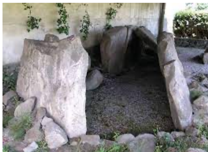
Fig. 2b - Mamoa "Neivatex"