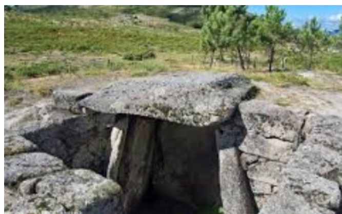
Fig. 3c - Mamoia 5 do Mezio

no conjunto de monumentos megalíticos designado “Antas da Serra do Soajo” que incorpora cerca de uma dezena, edificados há cerca de 5000 anos e distribuídos por dois quilómetros de planalto (fig.3a).