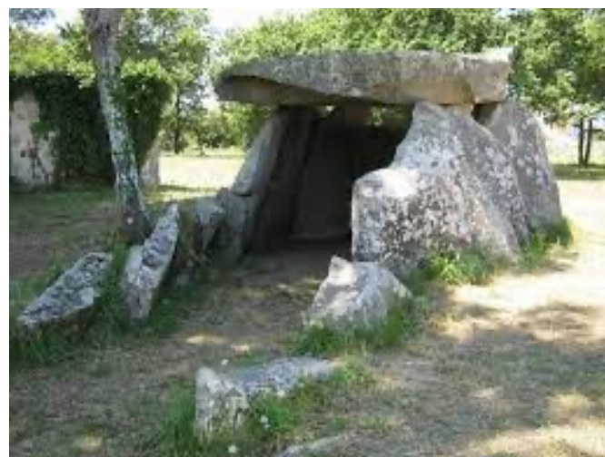
Fig. 6b - Vista de frente do dólmen da Barrosa

Tratava-se de túmulos de enterramento coletivo, que se desenvolveram, desde o Neolítico pleno até ao bronze inicial, ou seja, do V ao II milénio a.c. Foram encontradas algumas pinturas, tendo sido retirada uma pedra de esteio que se encontra em exposição no Museu Museológico de Afife (Brochado, 2008).