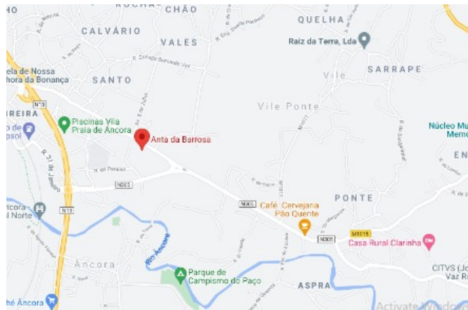
Fig. 6a - Localização do dólmen da Barrosa (Google maps)