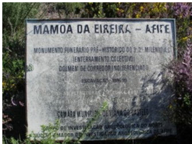
Fig. 5c - Identificação do monumento