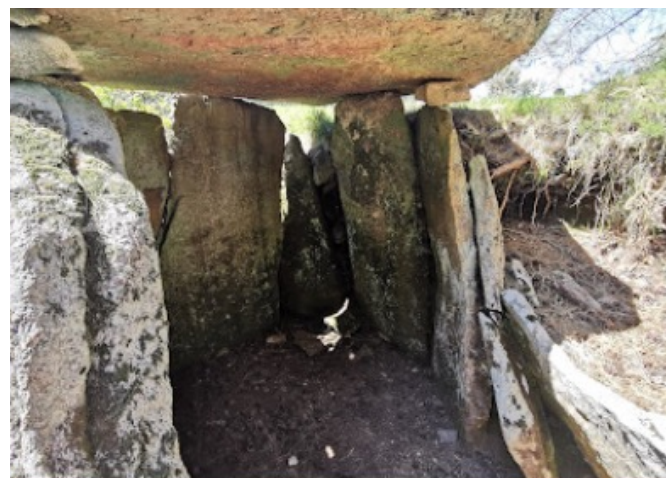
Fig. 1b - Dólmen do Batateiro