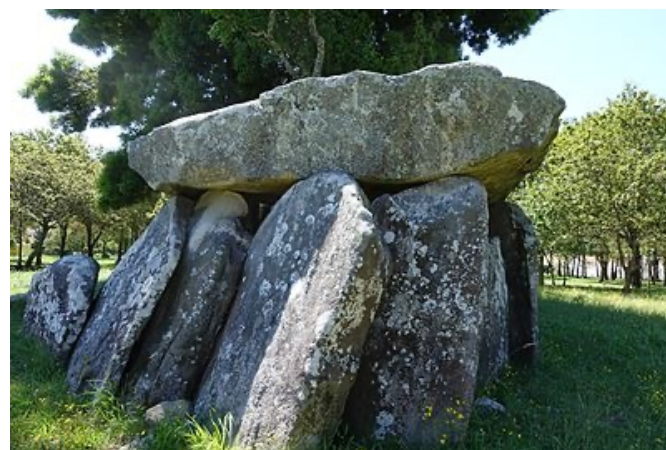
Fig. 6c - Vista Lateral do dólmen da Barrosa.

Apesar de ser monumento nacional, o Dólmen da Barrosa esteve localizado em terreno privado, e praticamente escondido pelos muros altos de uma quinta. É composto por câmara funerária de planta poligonal, pedra de cabeceira no topo e nove esteios. Tem ainda um corredor com cerca de um metro e meio de