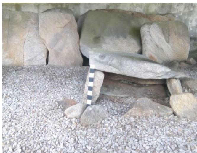
Fig. 2c - Cista de planta trapezoidal

Vira-se à direita ao km 56. 660, na rua Frei Jerónimo Vahia (fig.2a). O monumento situa-se no jardim da fábrica industrial têxtil, Neivatex.