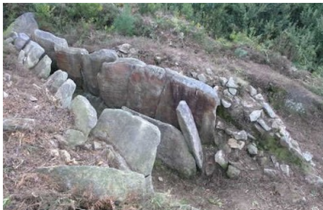
Fig. 5b - Mamoa da Eireira