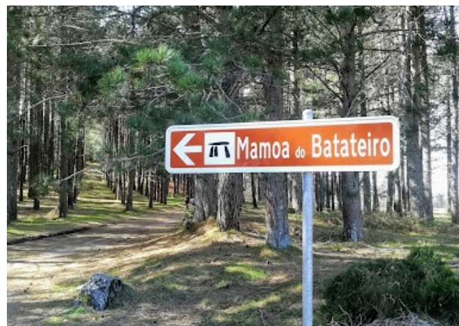
Fig. 1c - Sinalética de localização da mamoa