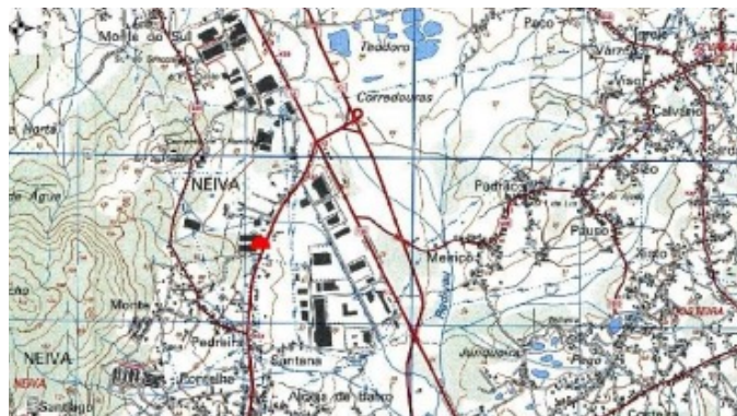
Fig. 2a - Mapa de localização da mamoa "Neivatex" (Carta militar de Portugal nº40)

A mamoa “Neivatex” é um monumento funerário megalítico, datado do período calcolítico. O acesso faz-se pela EN-13, ligação Porto – Viana do Castelo.